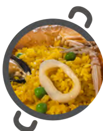
MARINERA Plus+ SAILOR Plus+