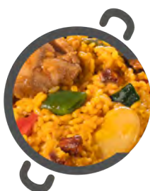
Paella IBÉRICA IBERIAN paella