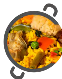
Paella VEGANA VEGAN paella