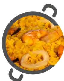
Arroz TRES DELICIAS Rice THREE DELIGHTS