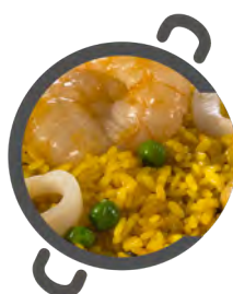
'SENYORET' Plus+ 'SENYORET' Plus+