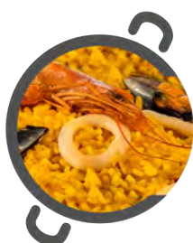
Arroz DE PATO DUCK's rice