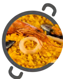
Paella DE MARISCO SEAFOOD paella