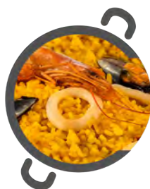
Arroz CON BACALAO Rice with COD