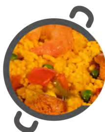
Paella MIXTA MIXED paella