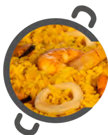
Arroz 'DEL SEÑORET' SEÑORET's rice