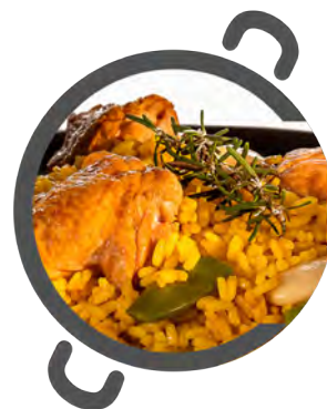
Paella VALENCIANA VALENCIAN paella

Enjoy real paellas and rice dishes anywhere.