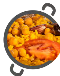
Arroz AL HORNO OVEN's rice