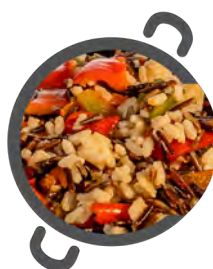
Arroz SALVAJE WILD rice