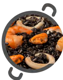
Arroz NEGRO BLACK rice