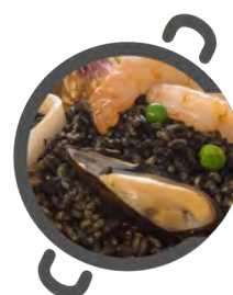
NEGRO Plus+ BLACK Plus+