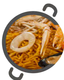
FIDEUÀ 'FIDEUÀ' ('noodle' paella)